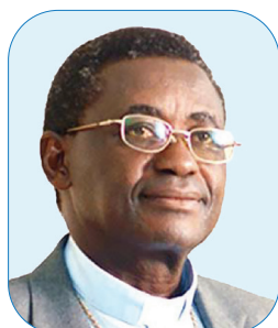
Askofu Mkuu Beatus Kinyaiya Mkurugenzi