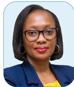
Bi Fortunata Olomi Afisa Mkuu Kitengo cha Biashara